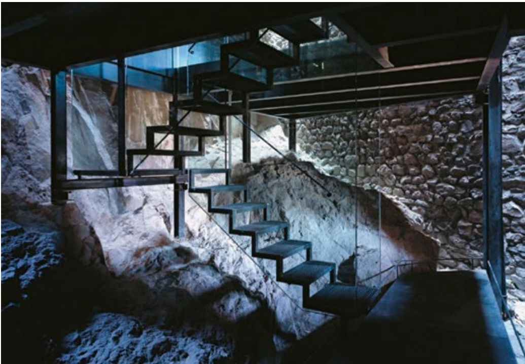
01 | Le strutture metalliche nere che sfiorano le murature originali del castello presentandosi come un'ombra all'interno degli spazi esistenti. The iron structures almost touch the original walls of the castle, appearing like a shadow inside the existing spaces.